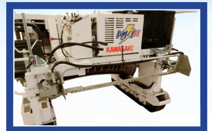
●長芽用剪枝ユニット