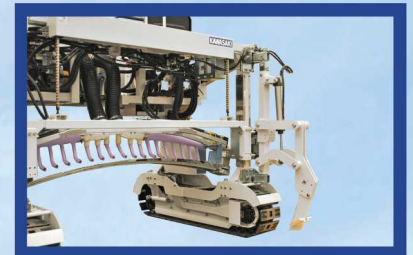
●ミニソイラーユニット