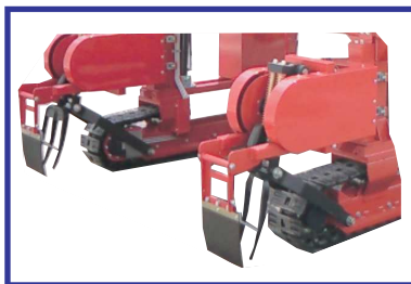
●鋤式深耕機 (オプション)