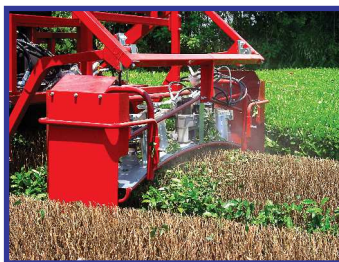
●後方剪枝装置 (オプション)

※機械の改良に伴い、予告なく仕様及び外観を変更することがありますのでご了承ください。