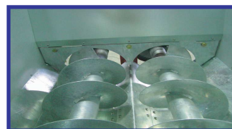
●バケット内スクリュウ部