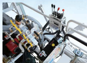
●コントローラー部