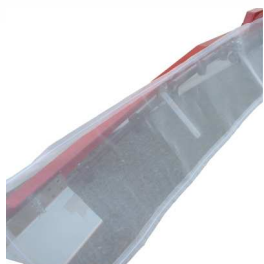
●飛散低減カバー (オプション)